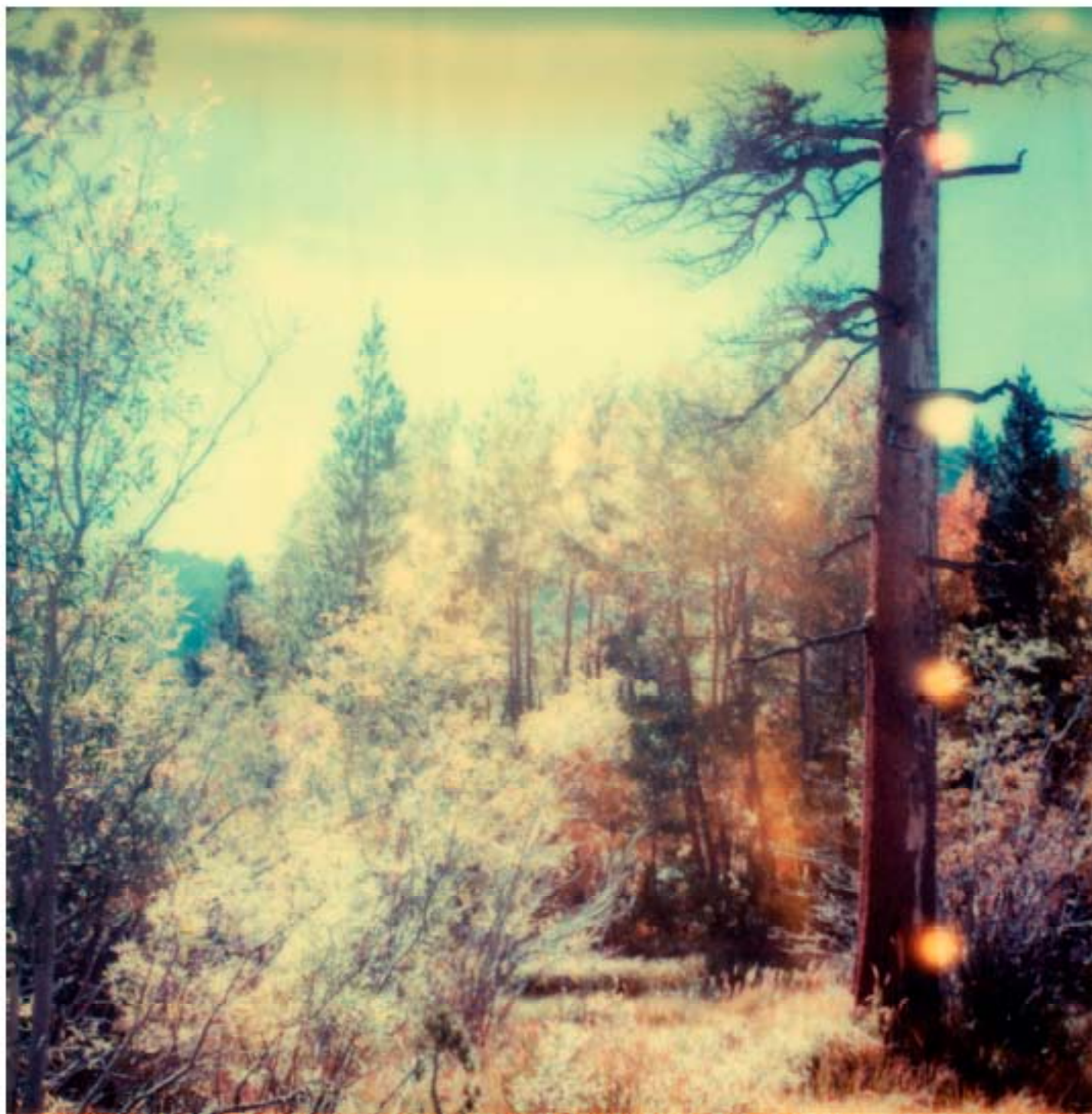
STEFANIE SCHNEIDER, Untitled (Wasteland) , from the series Selection , 2003. Polaroid, 60x70 cm and 120x120 cm.