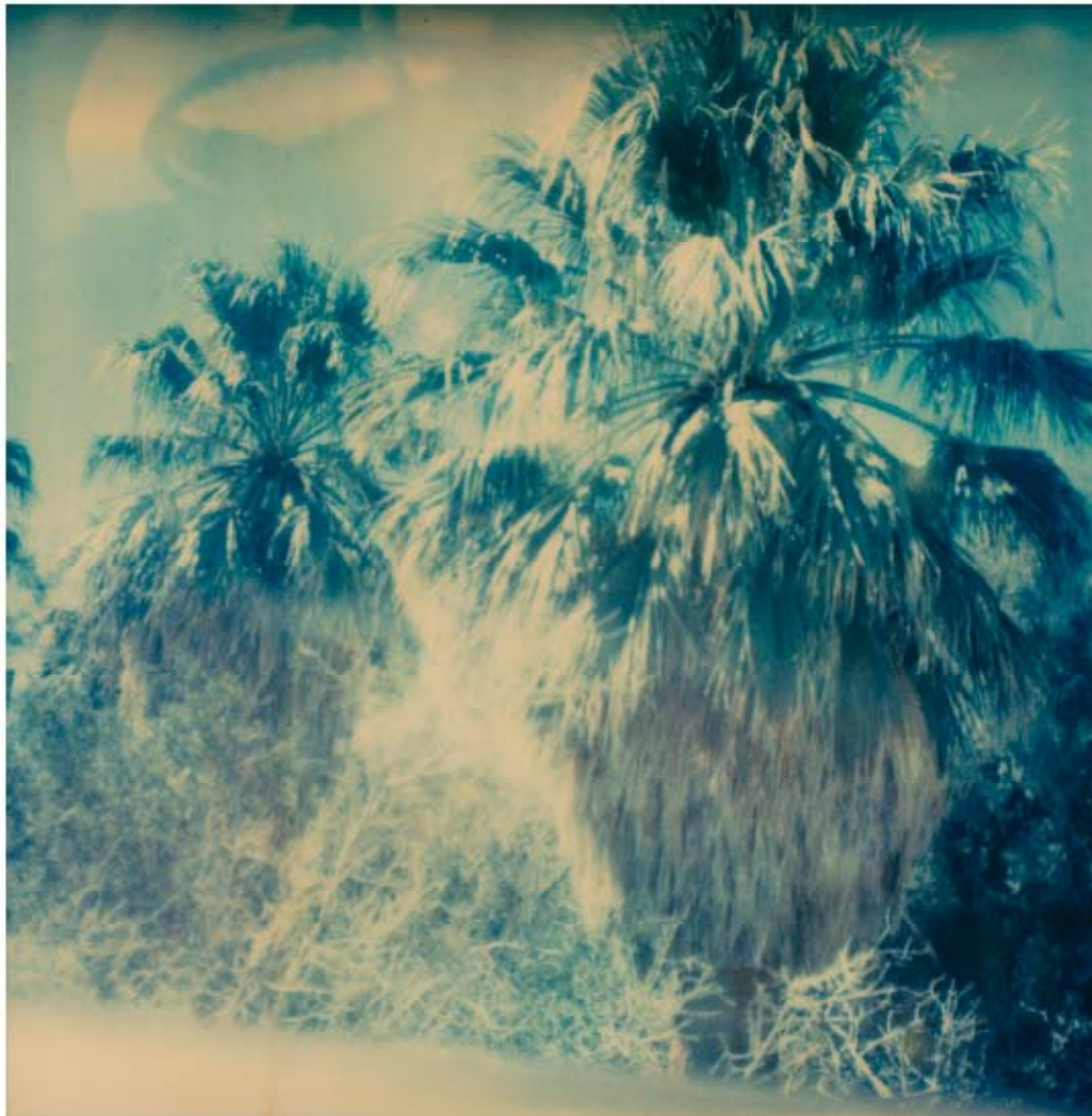
STEFANIE SCHNEIDER, Untitled , from the series Sidewinder , 2005. Polaroid, 80x80 cm.