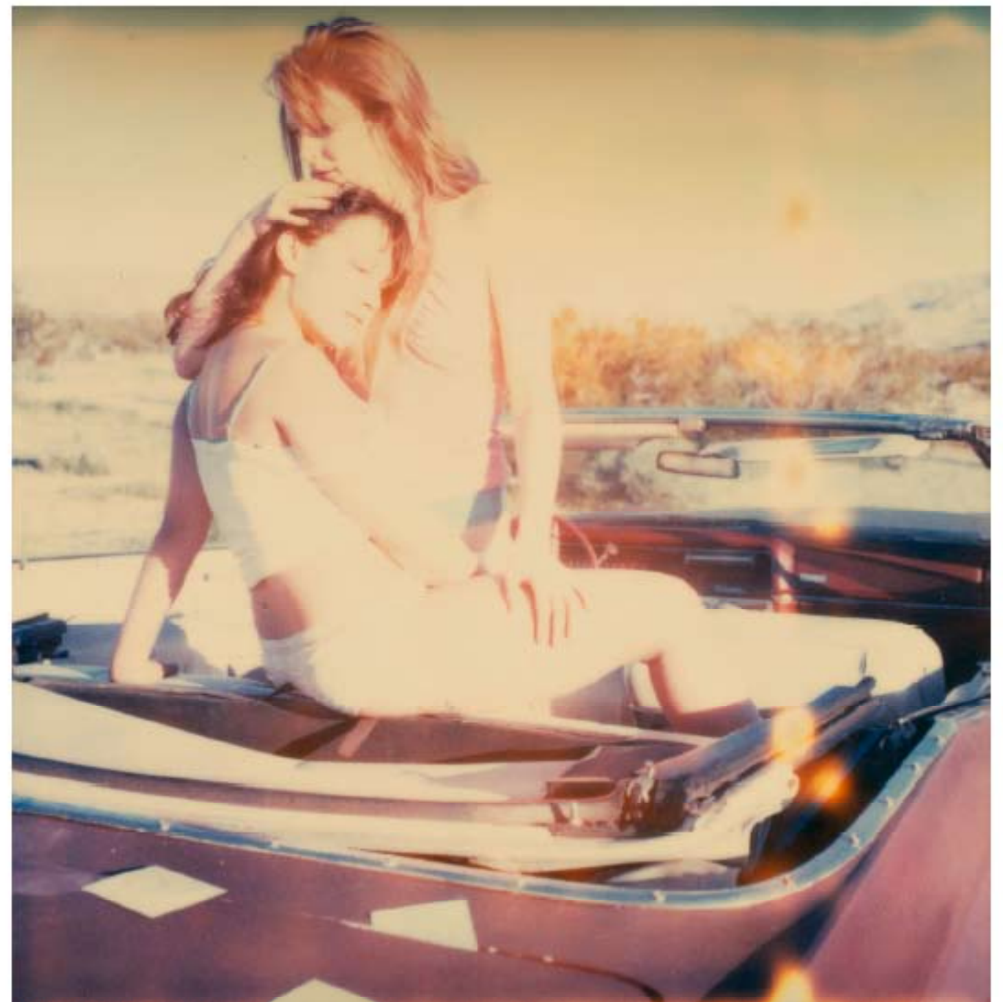
STEFANIE SCHNEIDER, Untitled (Making Out in Car) , from the series Hitchhiker , 2005. Polaroid, 100x100 cm.