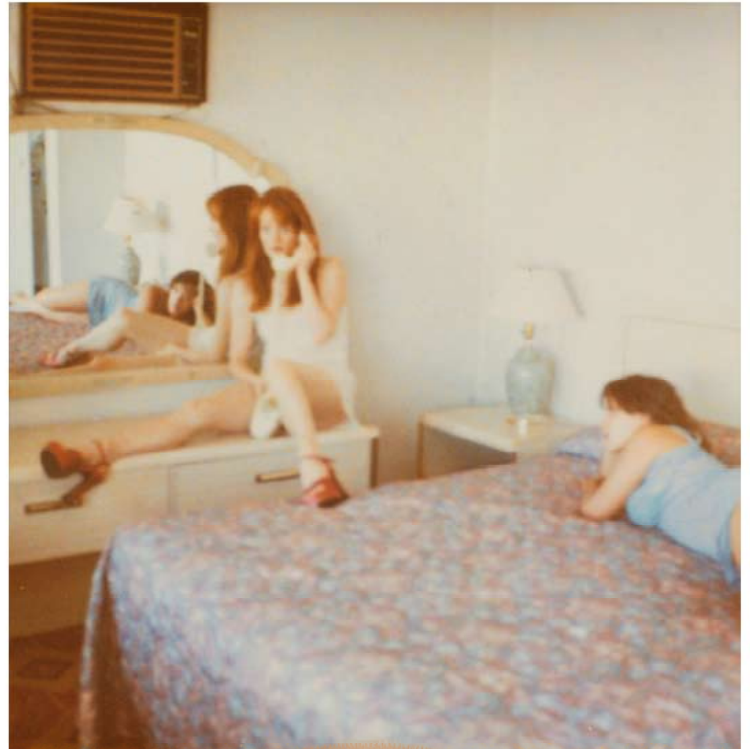
STEFANIE SCHNEIDER, Untitled (Hill View Motel) , from the series Hitchhikers , 2005. Polaroid, 80x80 cm.