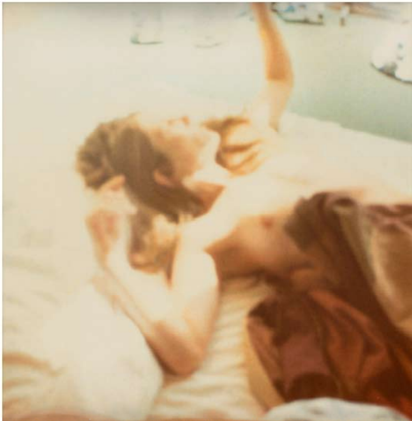
STEFANIE SCHNEIDER, Untitled , from the series Sidewinder , 2005. Polaroid, 120x120 cm.